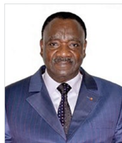
Jean Koffi EDOH

Enfin, j'exprime mes vives félicitations au personnel de la Cour, principale richesse de l'institution, qui ne cesse de se dévouer et dont la contribution sera déterminante, pour l'atteinte des objectifs fixés, au bénéfice de l'ensemble des togolais. Je demeure convaincu que grâce à la volonté et à la détermination des uns et des autres, nous parviendrons à la réalisation de nos ambitions, celles d'apporter notre pierre à l'édification d'un Togo émergent en 2030.